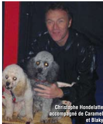
Christophe Hondelatte accompagné de Caramel et Blaky