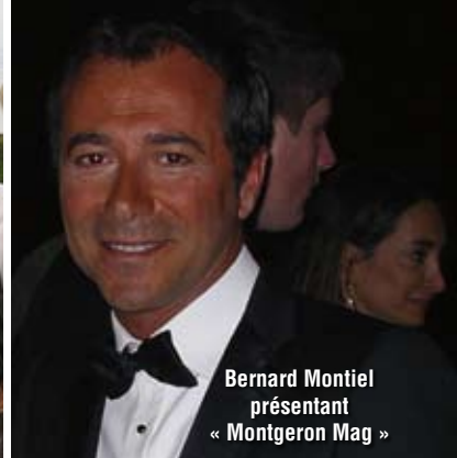
Bernard Montiel présentant « Montgeron Mag »